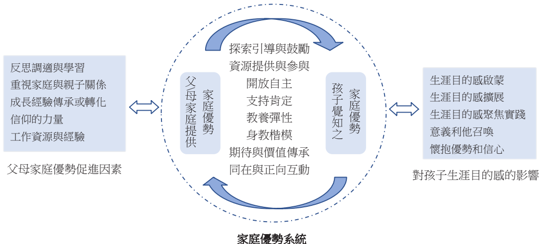
圖 2 親子家庭優勢對促進子女生涯目的感發展之影響模式

根據研究結果，進一步建立親子家庭優勢對促進子女生涯目的感發展之影響模式如下圖 2。並說明如下。